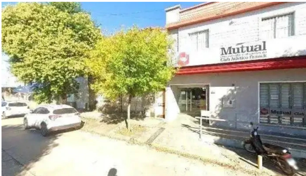
Mutual clu atletico franck descuentos