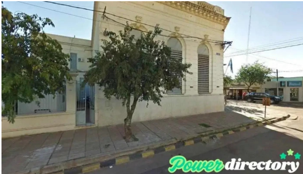
Creditos del plata santo tome