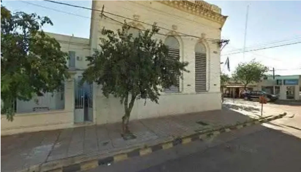
Creditos del plata ubicacion