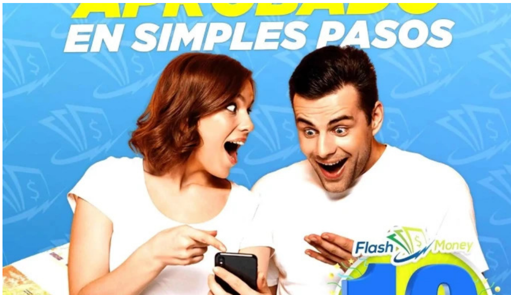
Flash money del propietario