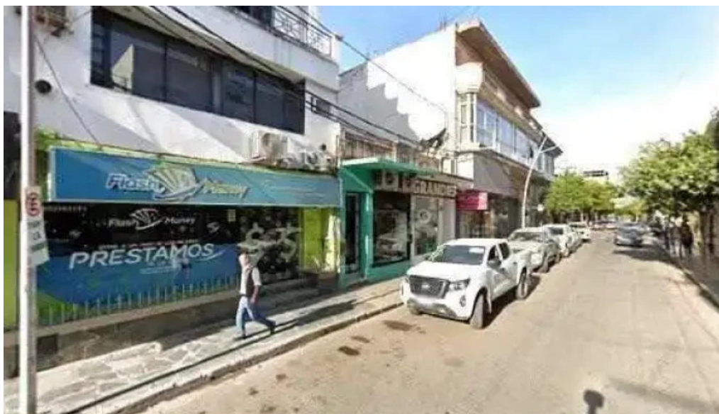
Flash money como llegar