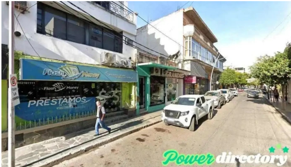
Flash money santiago del estero