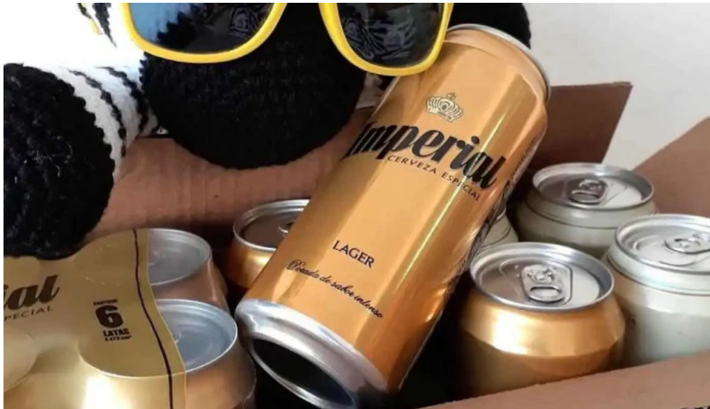
El capital como llegar