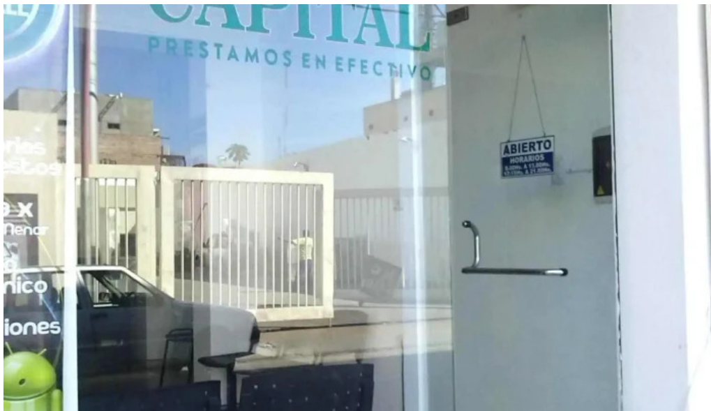
El capital exterior