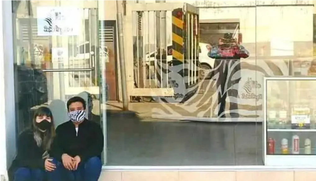
El capital del propietario