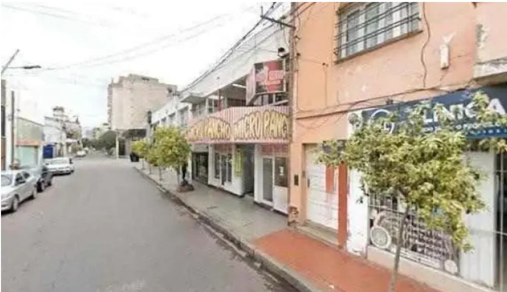
El capital como llegardeg