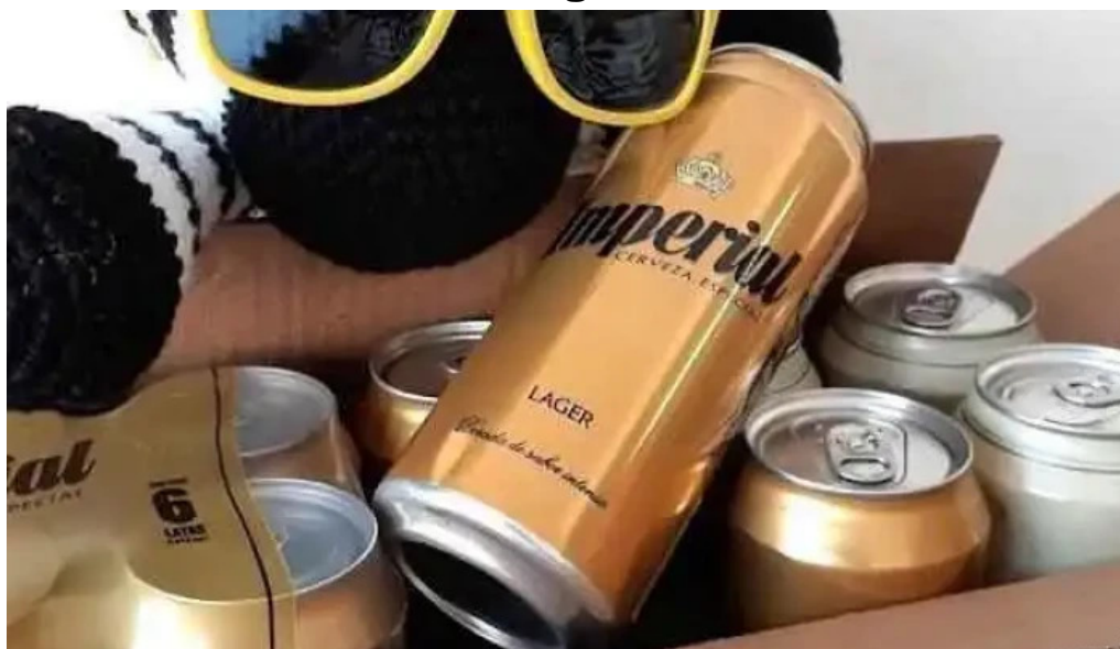
El capital santiago del estero