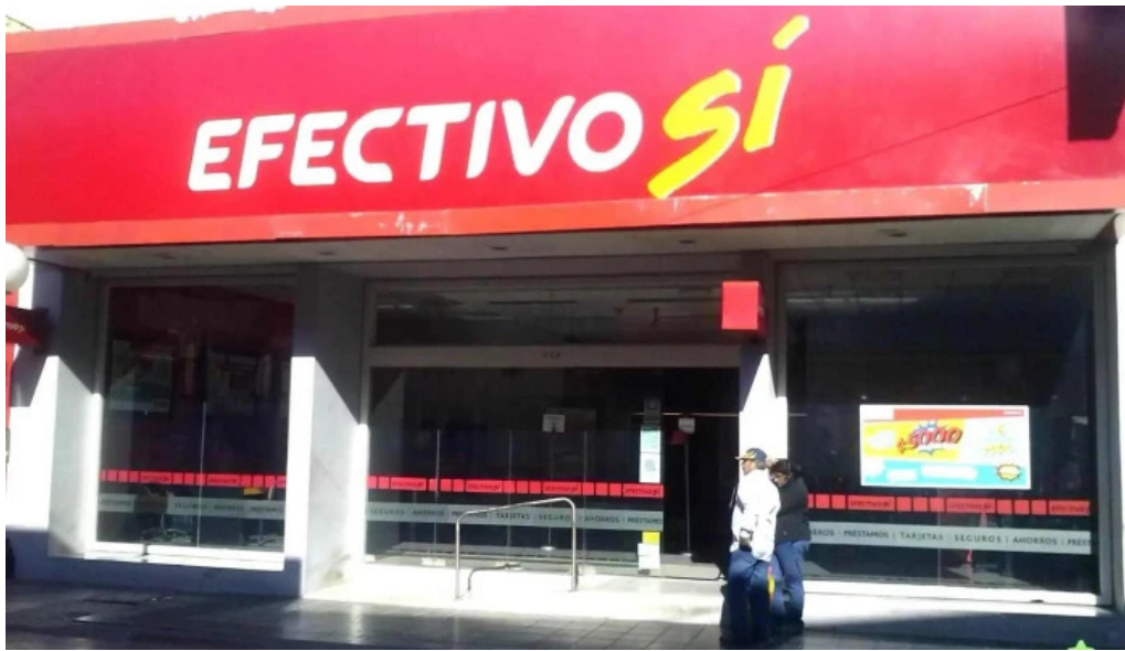
Efectivo si santiago del estero promocion

Efectivo si santiago del estero promociondeg