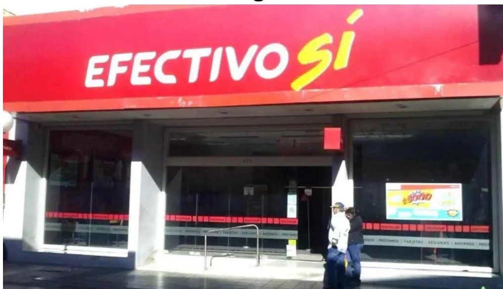
Efectivo si santiago del estero santiago del estero