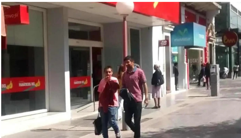
Efectivo si santiago del estero exterior