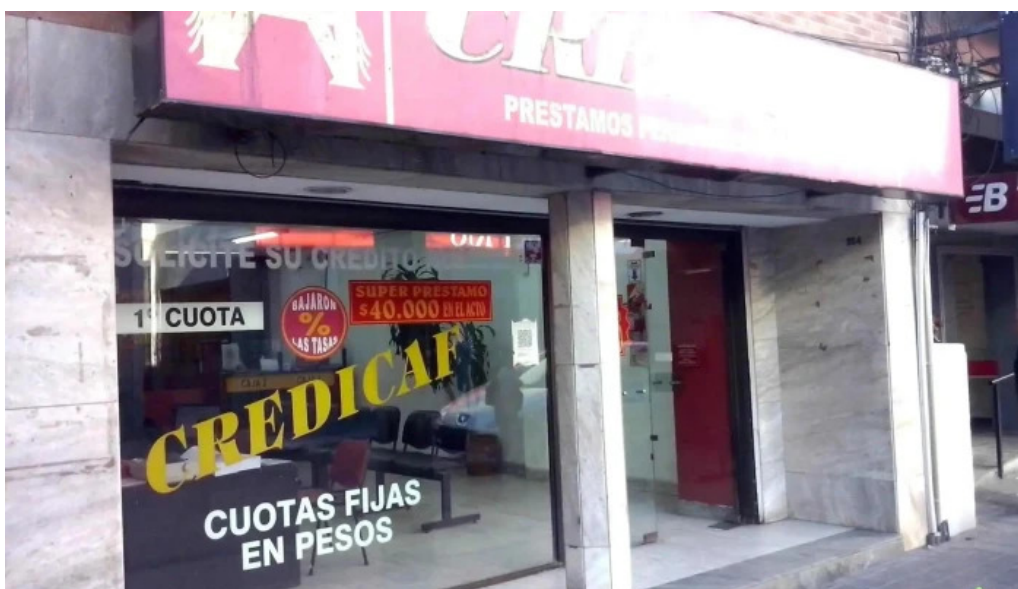
Credicaf srl comentarios