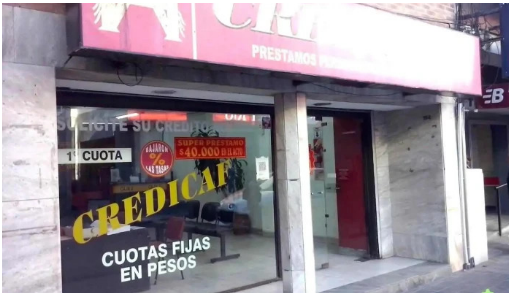
Credicaf srl santiago del estero