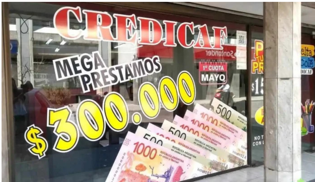
Credicaf srl del propietario