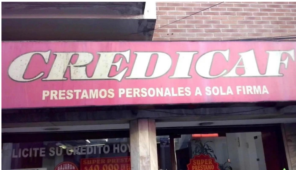
Credicaf srl exterior