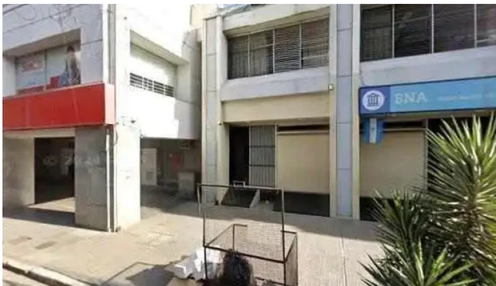
Credicaf srl comentariosdeg