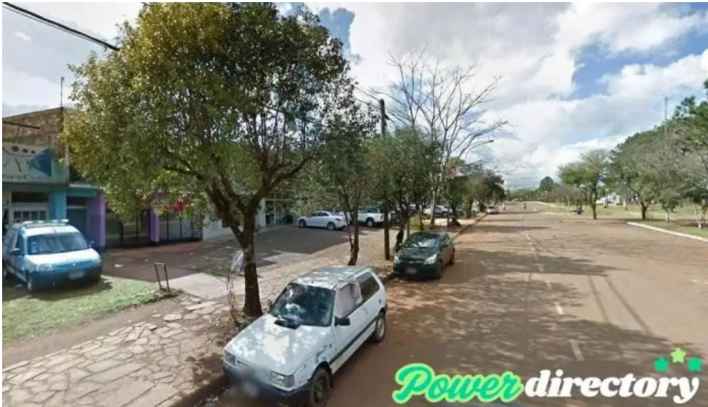
Corefin san vicente