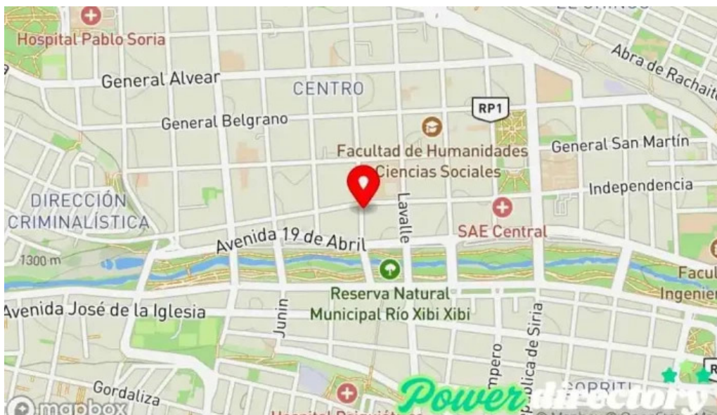
Valores innovacion en inversiones mapa