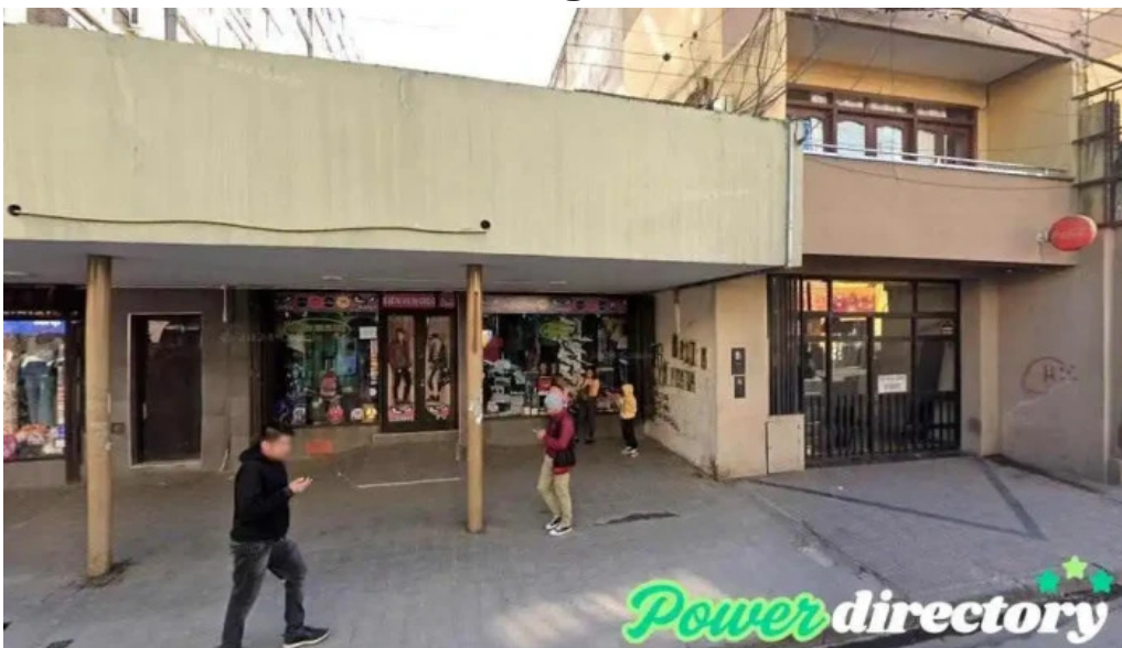
Federar san salvador de jujuy