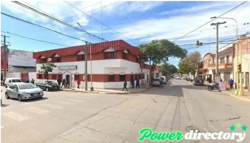
Prestamos personales san pedro de jujuy