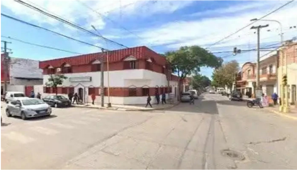
Prestamos personales telefono