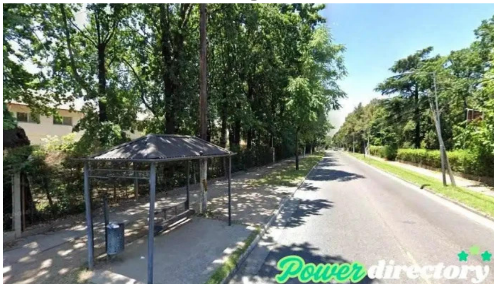
Prestamos al acto san miguel