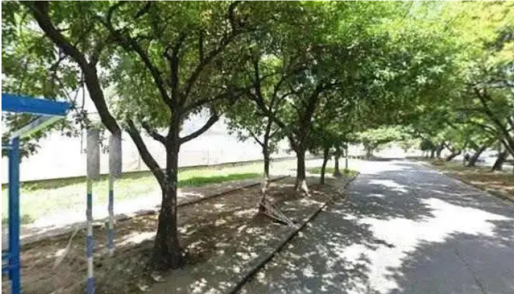
Tarjeta nevada como llegar