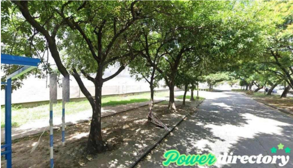
Tarjeta nevada san miguel de tucuman