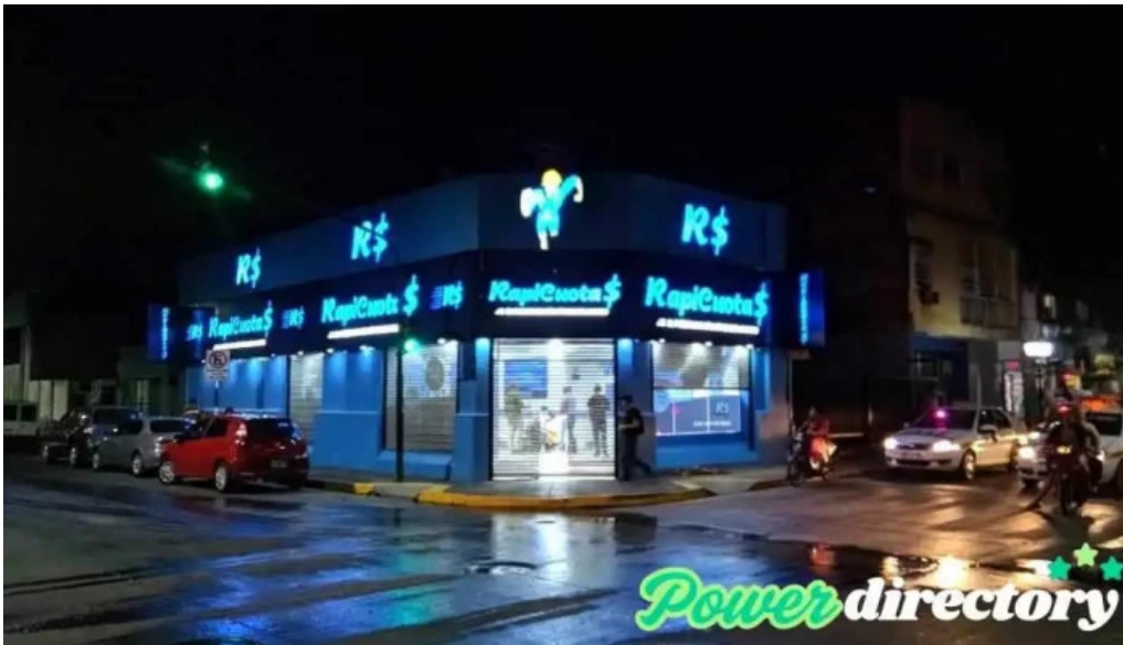
Rapicuotas san miguel de tucuman