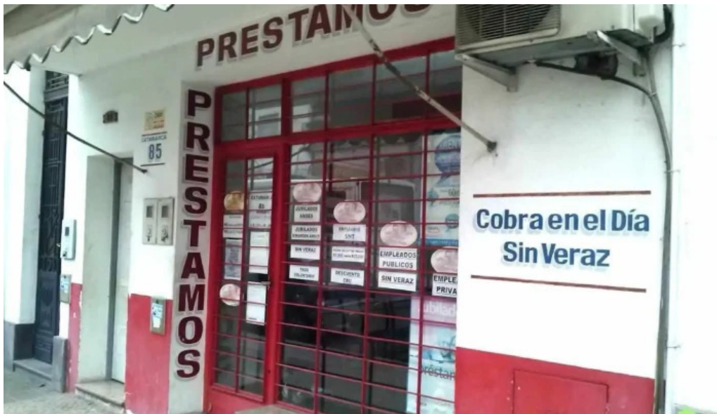
Prestamos catamarca 85 san miguel de tucuman