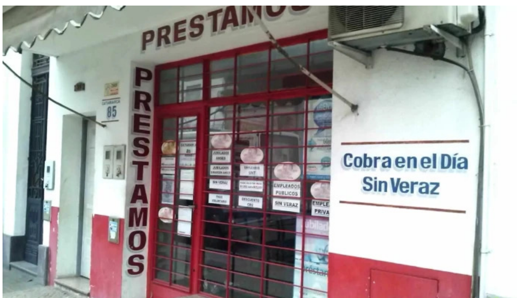
Prestamos catamarca 85 donde