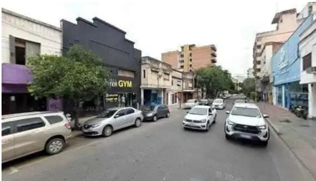
Prestamos catamarca 85 dondedeg