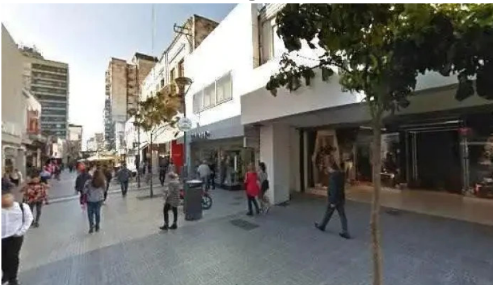
Efectivo si sitio web