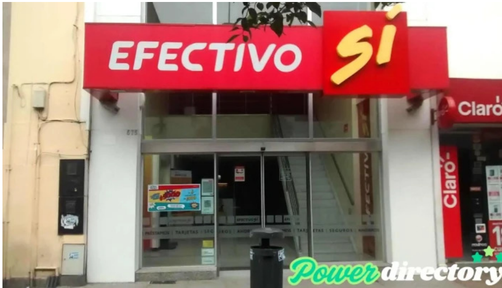
Efectivo si exterior