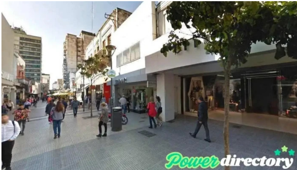
Efectivo si san miguel de tucuman