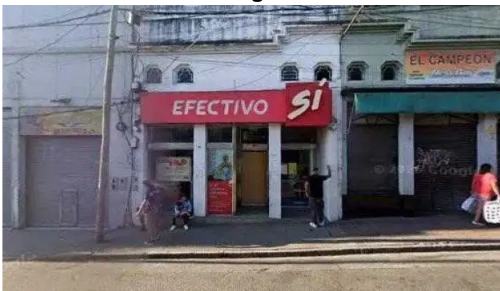
Efectivo si san miguel de tucuman zonadeg