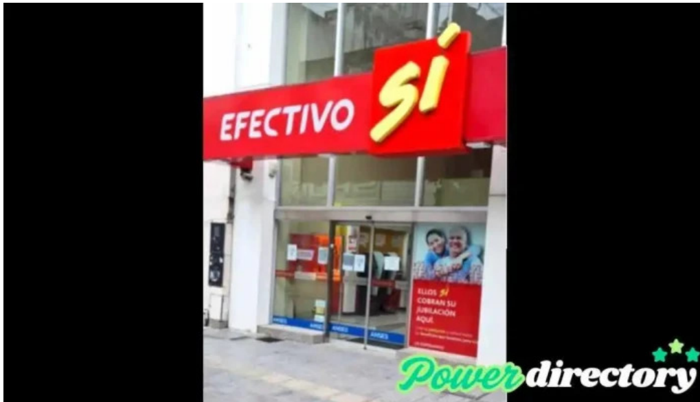
Efectivo si san miguel de tucuman zona