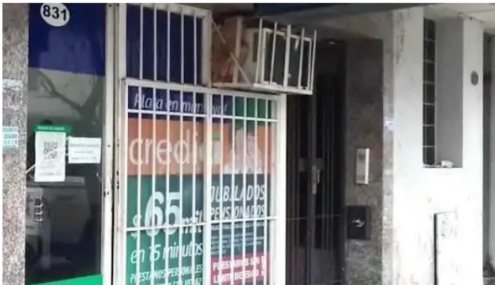
Credici san miguel de tucuman