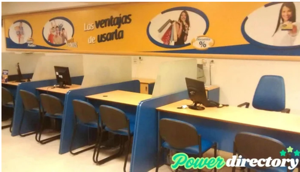
Credi cash interior