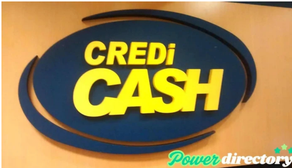
Credi cash san miguel de tucuman