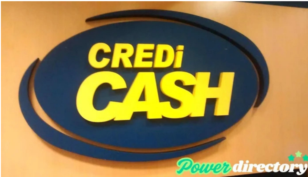
Credi cash promocion