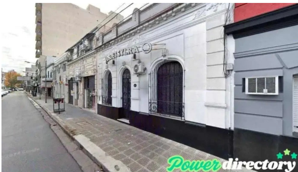
Cuotitas san martin