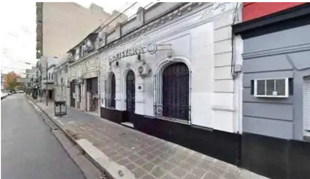
Cuotitas sitio web