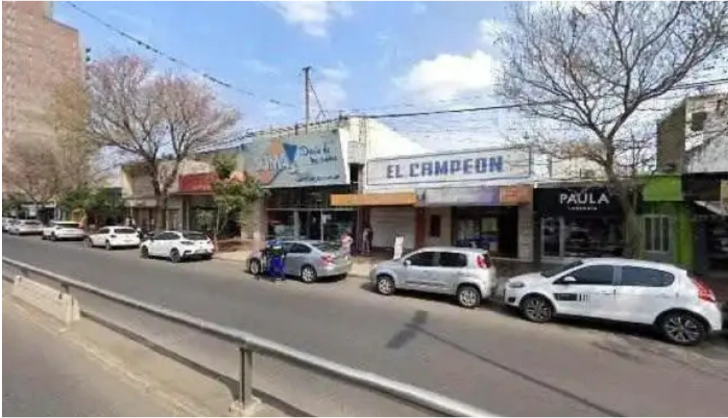
Credife cerca de mi