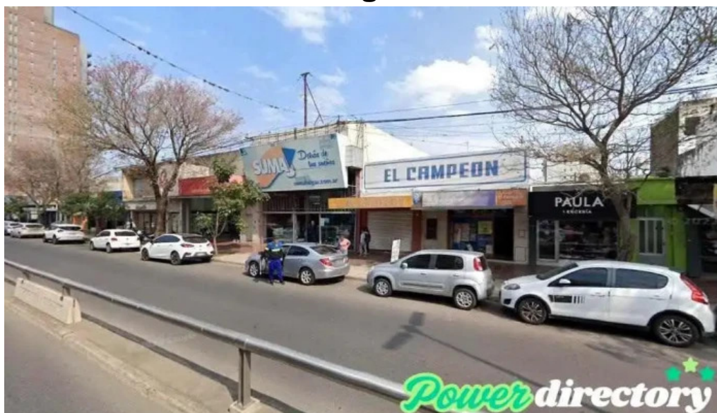
Credife san lorenzo