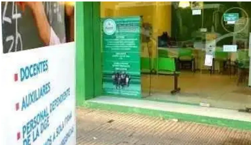
Red comercial argentina sucursal san justo exterior