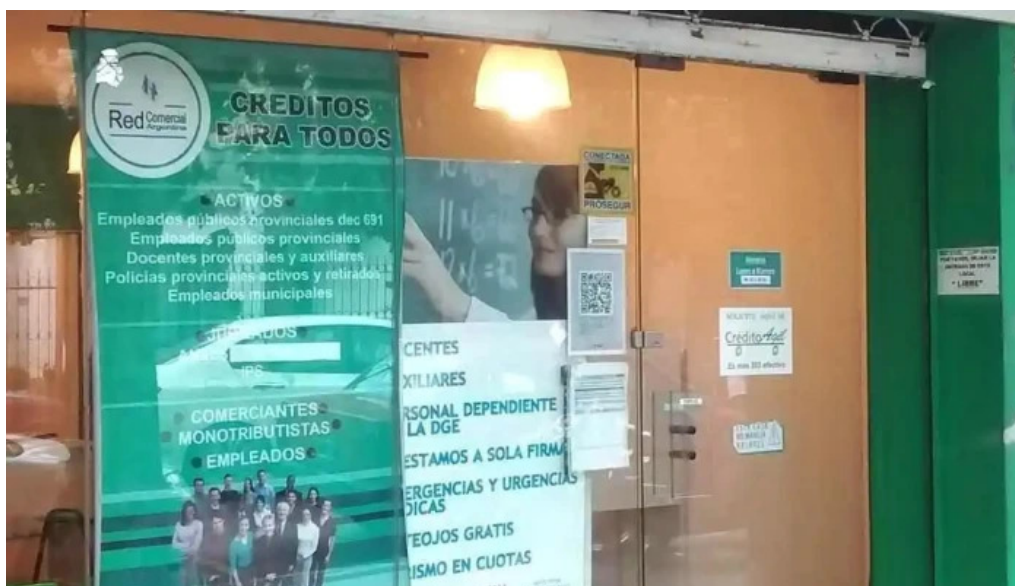
Red comercial argentina sucursal san justo cerca de mi