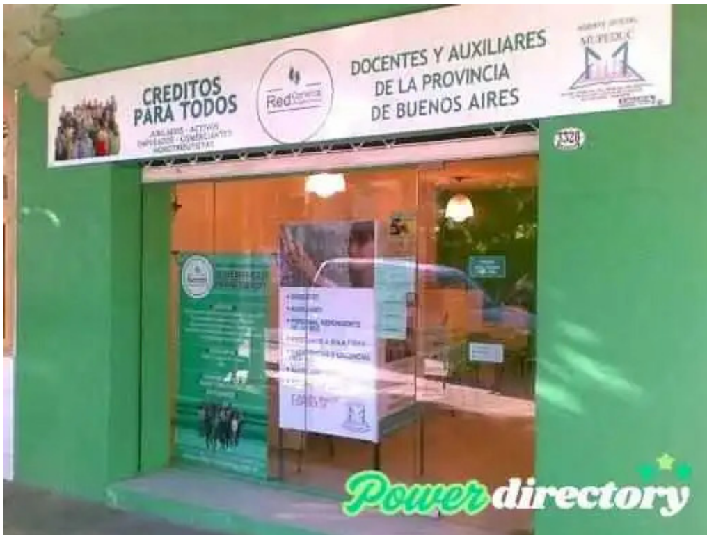
Red comercial argentina sucursal san justo del propietario