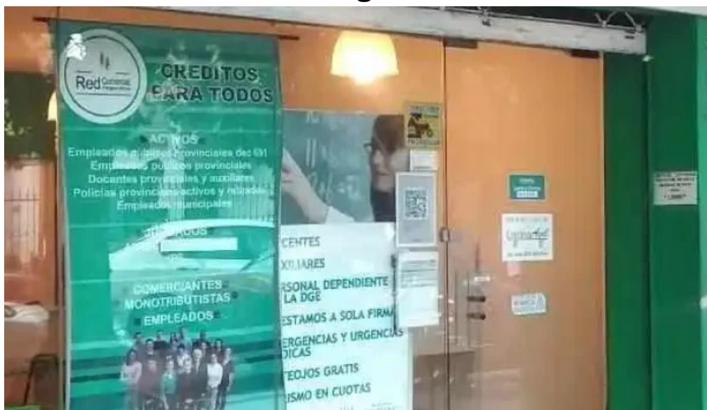
Red comercial argentina sucursal san justo san justo