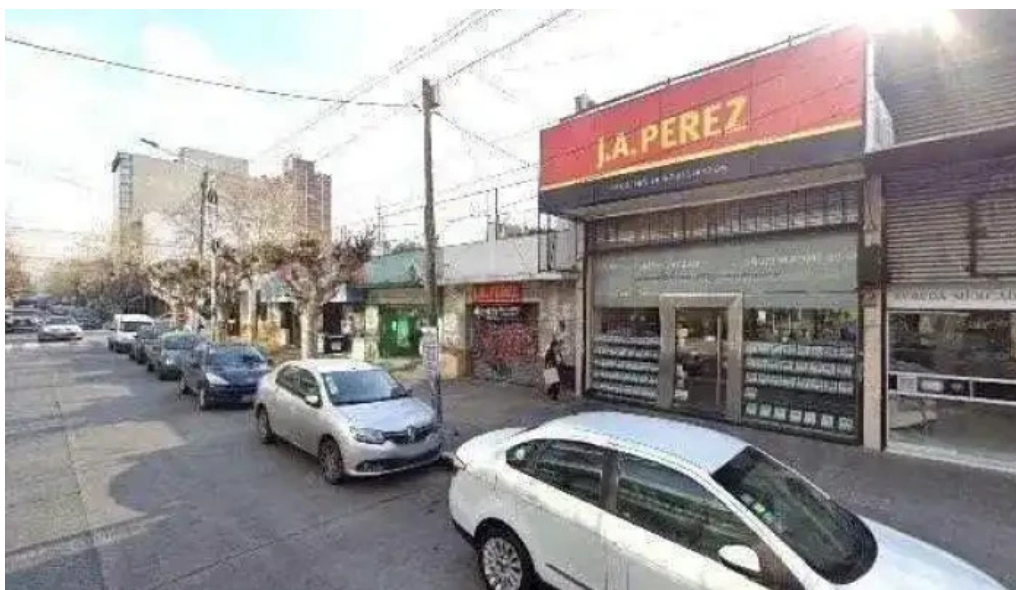
Red comercial argentina sucursal san justo cerca de mideg