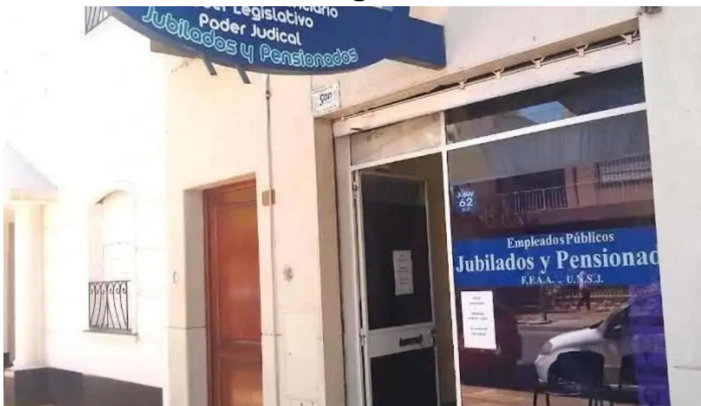
Préstamos personales rsb san juan