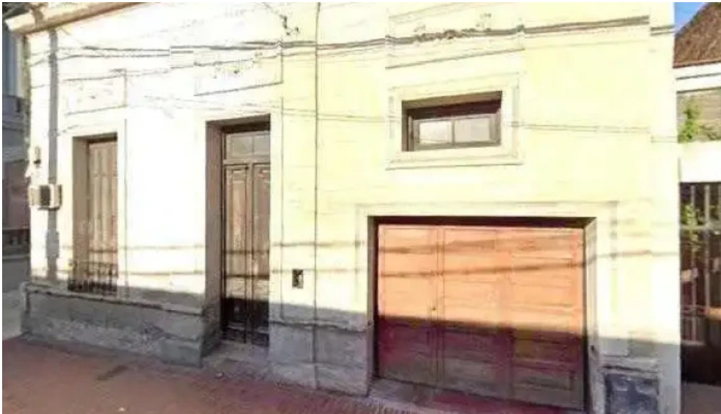
Rapicuotas como llegar