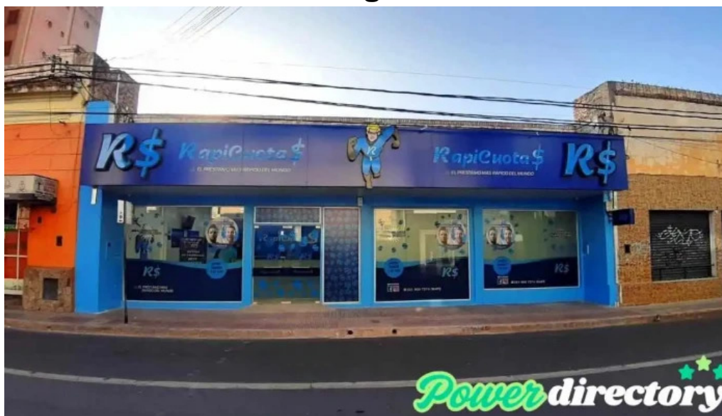
Rapicuotas san fernando del valle de catamarca