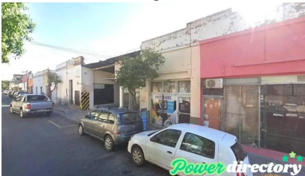
Prestamos la vitalicia san fernando del valle de catamarca