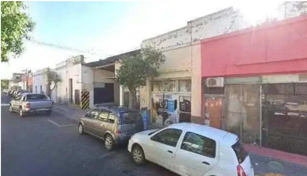
Prestamos la vitalicia promocion