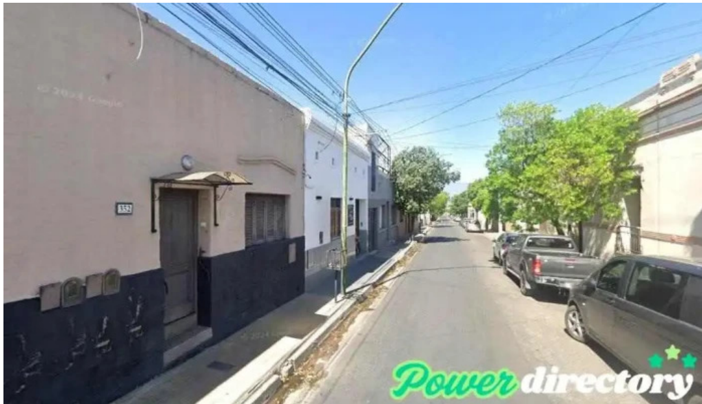
Prestamos jaer san fernando del valle de catamarca