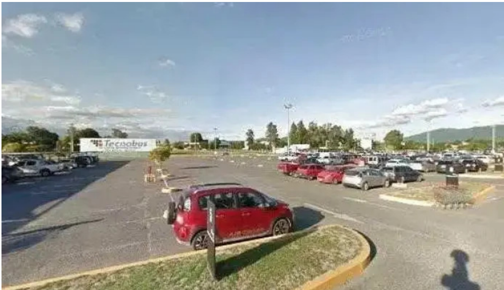
Tarjeta shopping abierto ahora