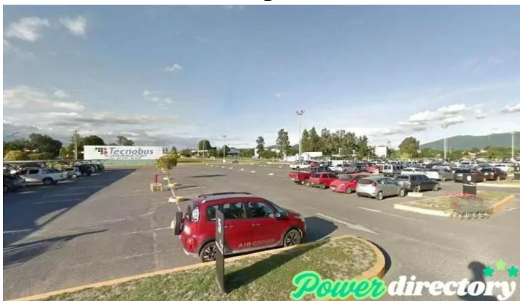
Tarjeta shopping salta