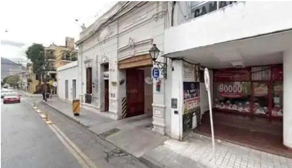
Prestamos personales torresdimaria consultora horario