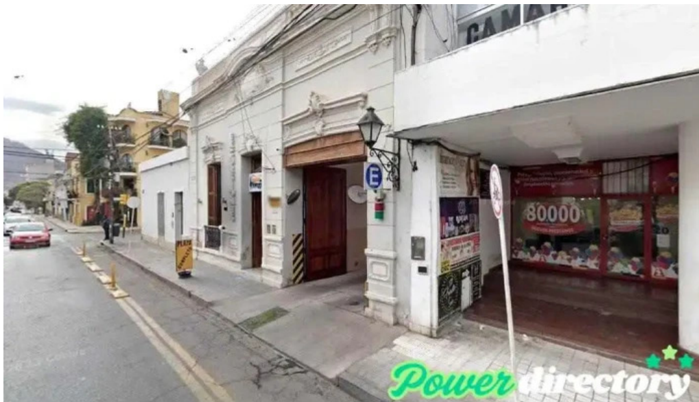
Prestamos personales torresdimaria consultora salta