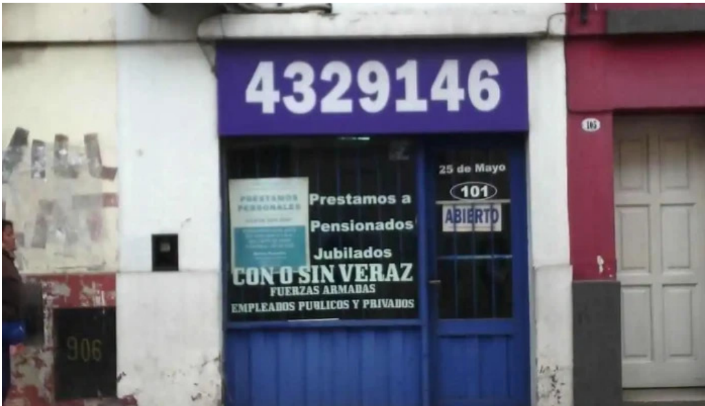
Prestamos en el acto fotos