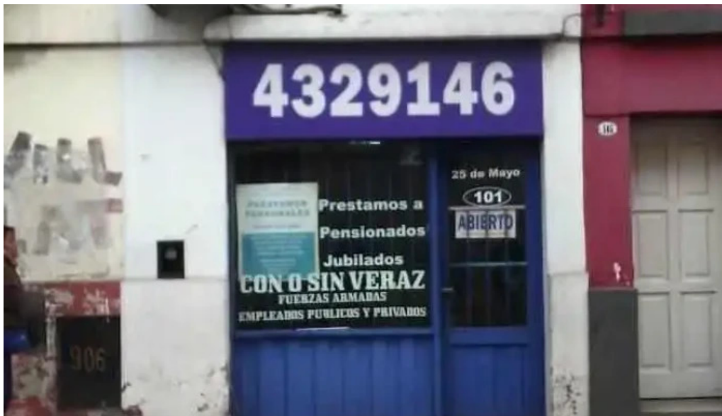
Prestamos en el acto salta