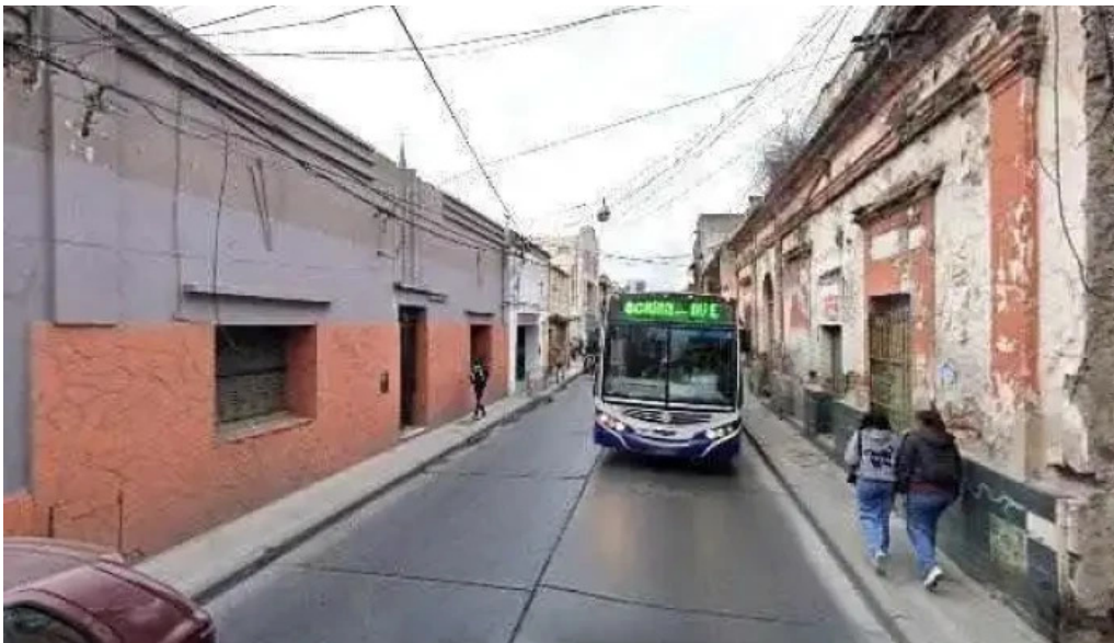
Gestion creditos numerodeg