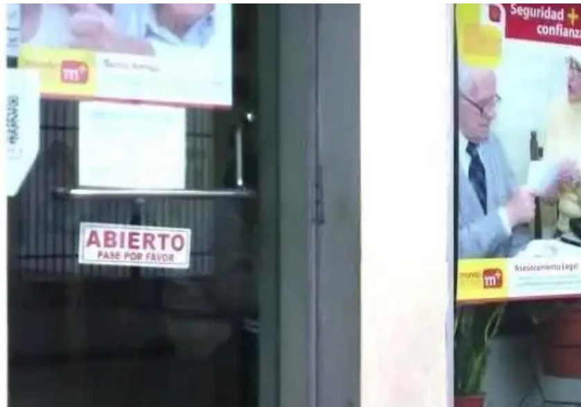
Gestion creditos salta