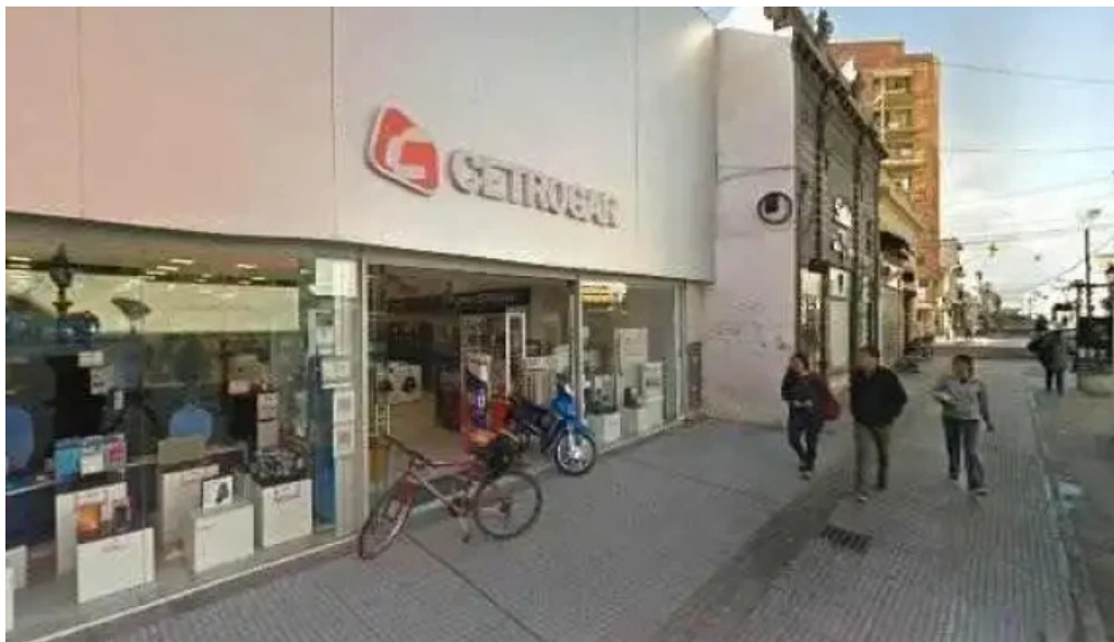
Federar como llegar