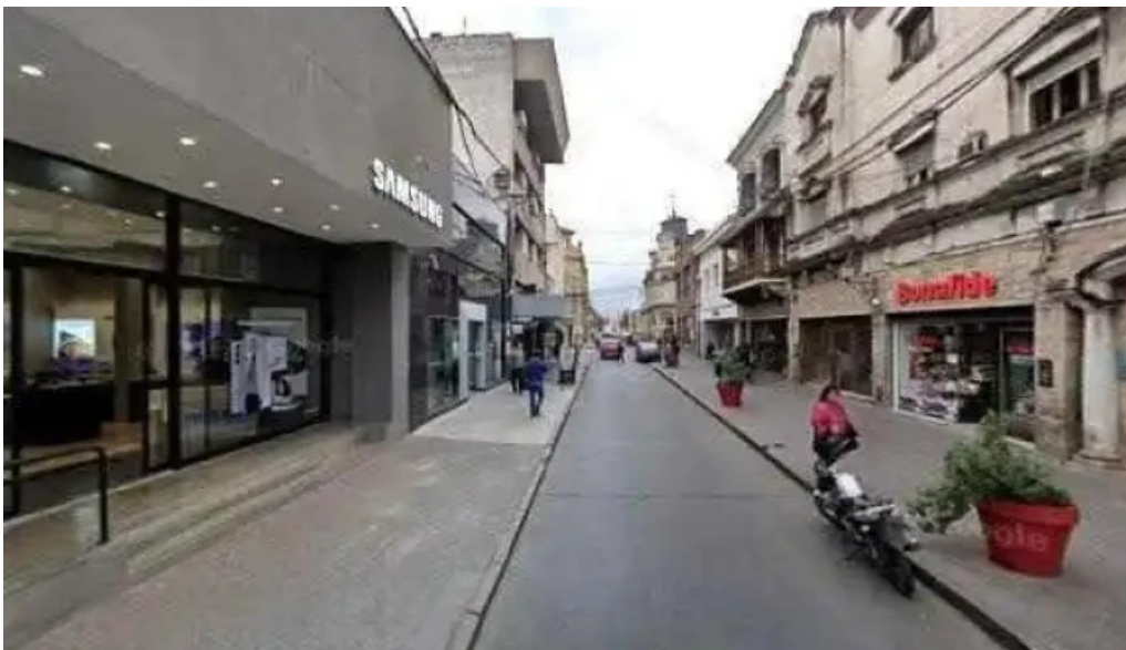
Federar sitio web