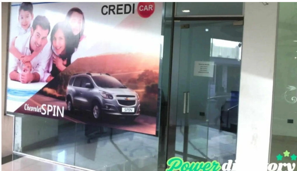
Credi car videos