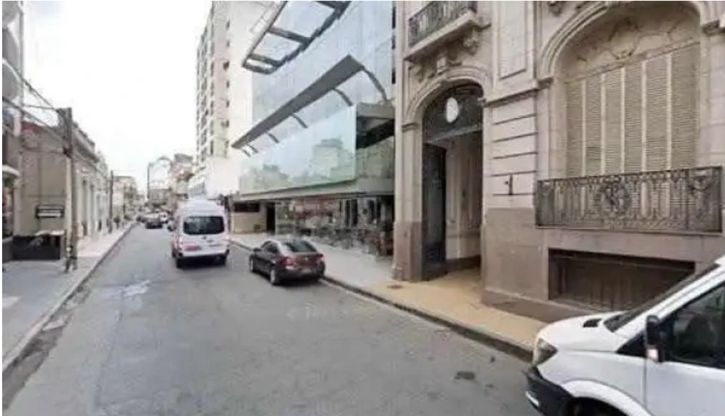
Credi car videosdeg