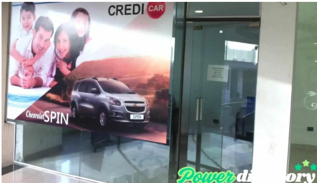
Credi car salta