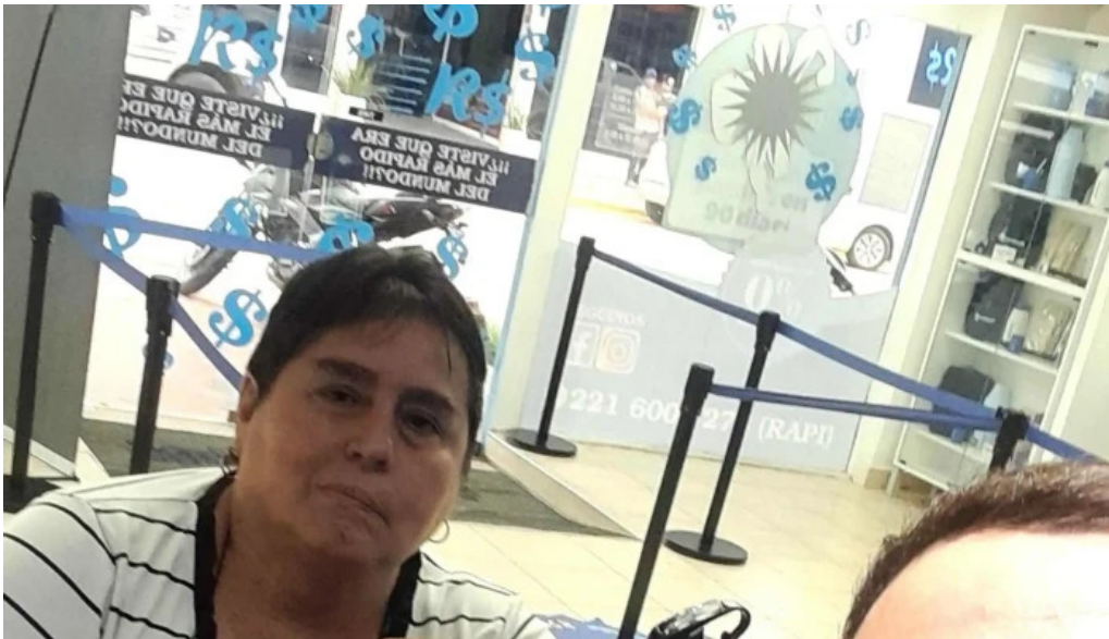
Rapicuotas saenz pena