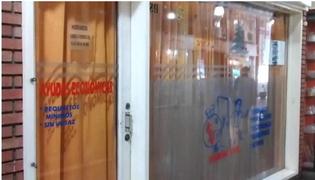
Soluciones en efectivo exterior