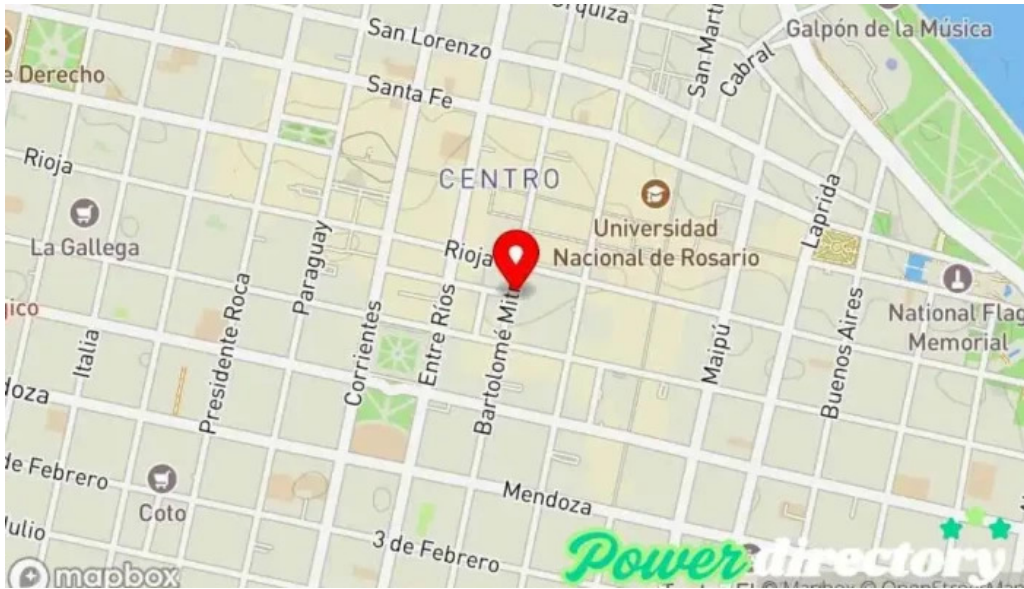
Soluciones en efectivo mapa