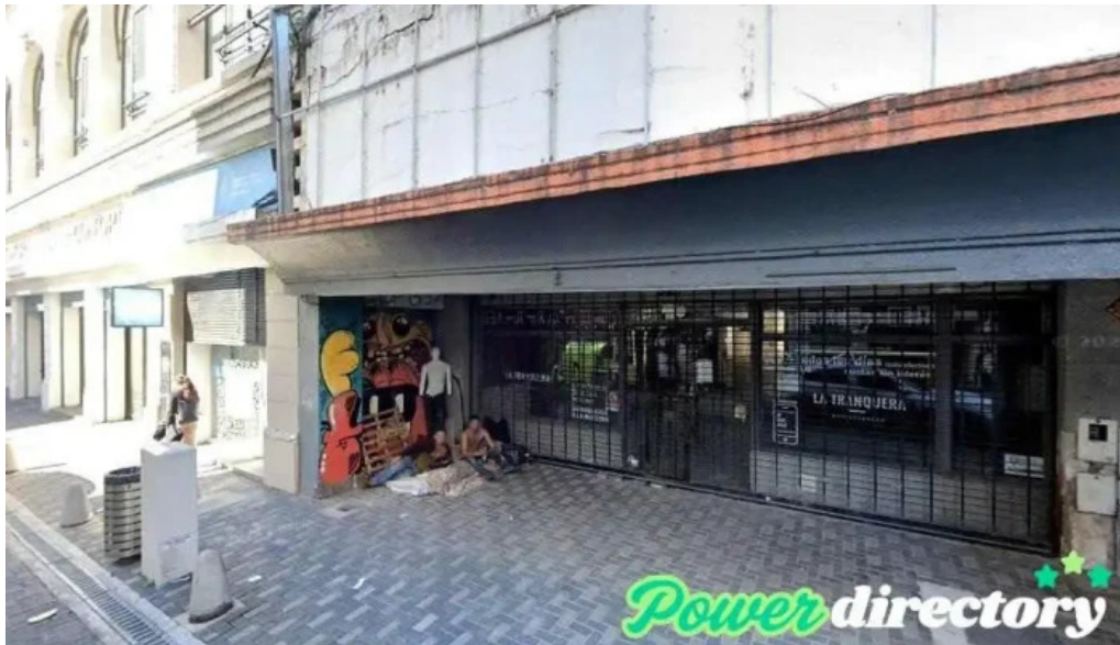
Red crediticia rosario