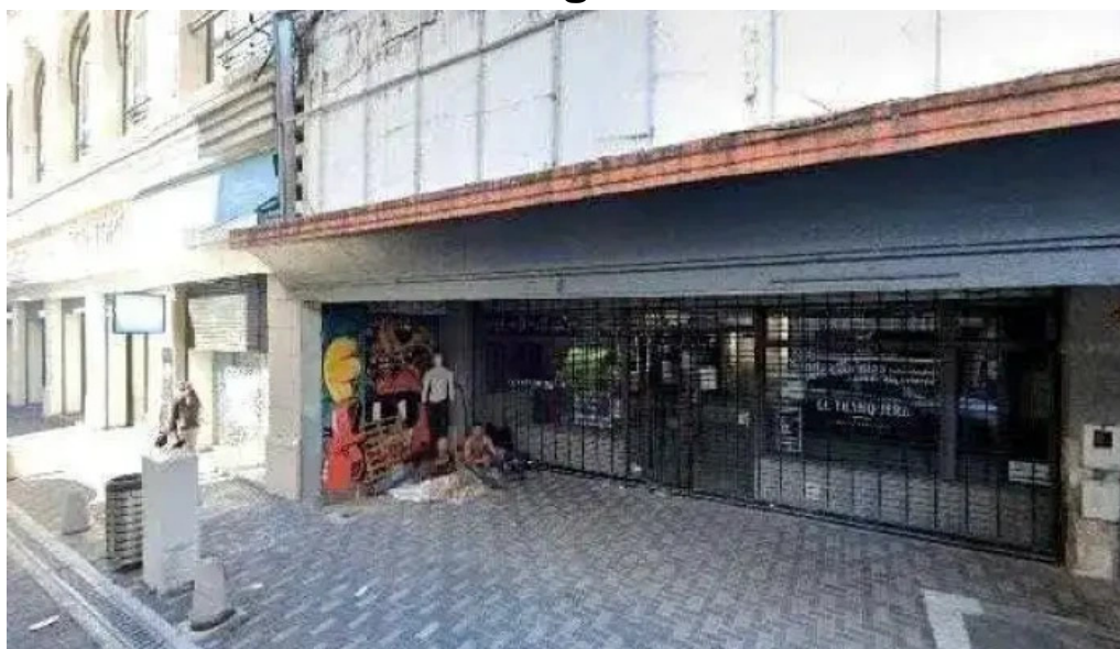
Red crediticia zona