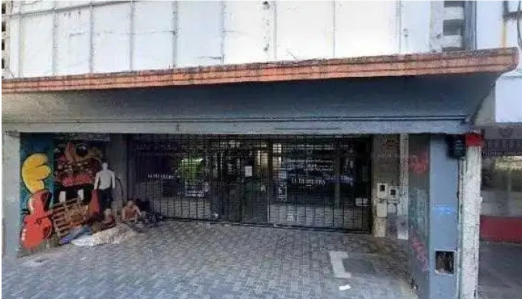
Prestamos con veraz rosario numero