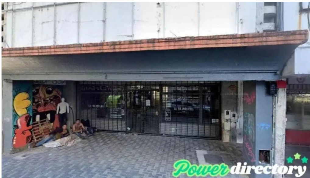
Prestamos con veraz rosario rosario