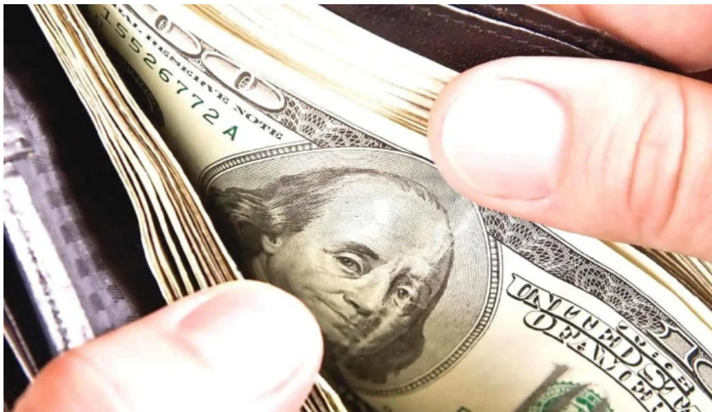
Prestamos con tarjeta de credito rosario del propietario