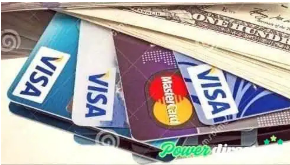
Prestamos con tarjeta de credito rosario rosario