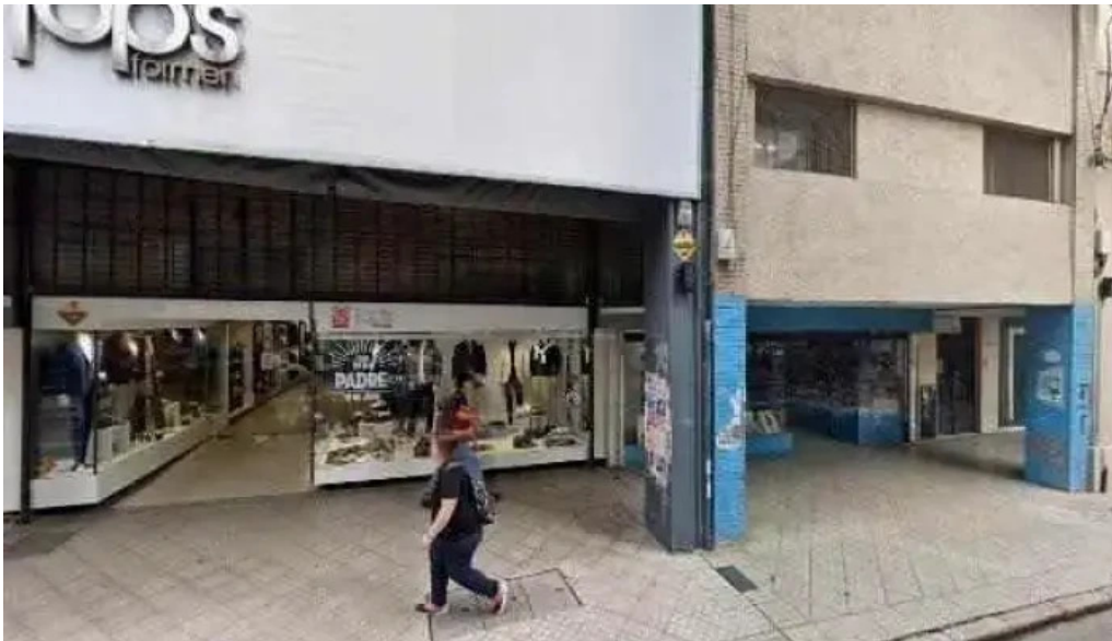
Prestamos con tarjeta de credito rosario zona