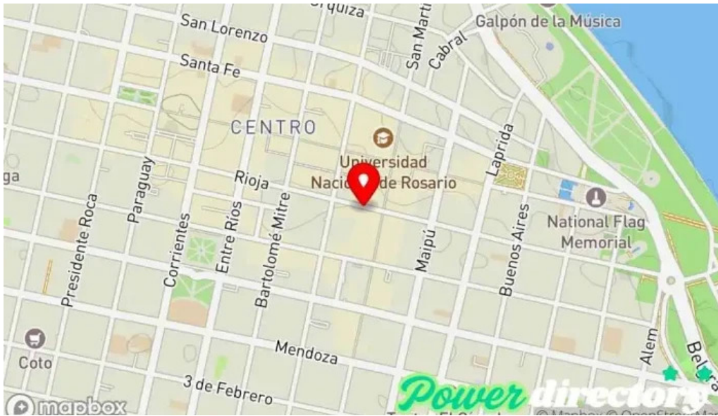
Ch comercializadora de creditos mapa