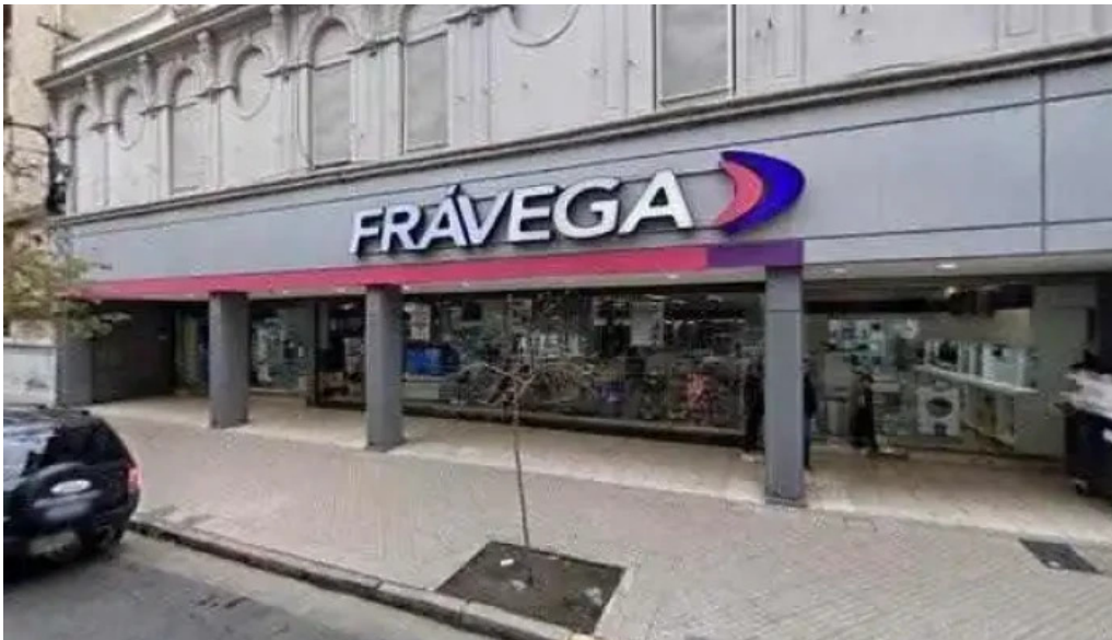
Ch comercializadora de creditos ubicacion