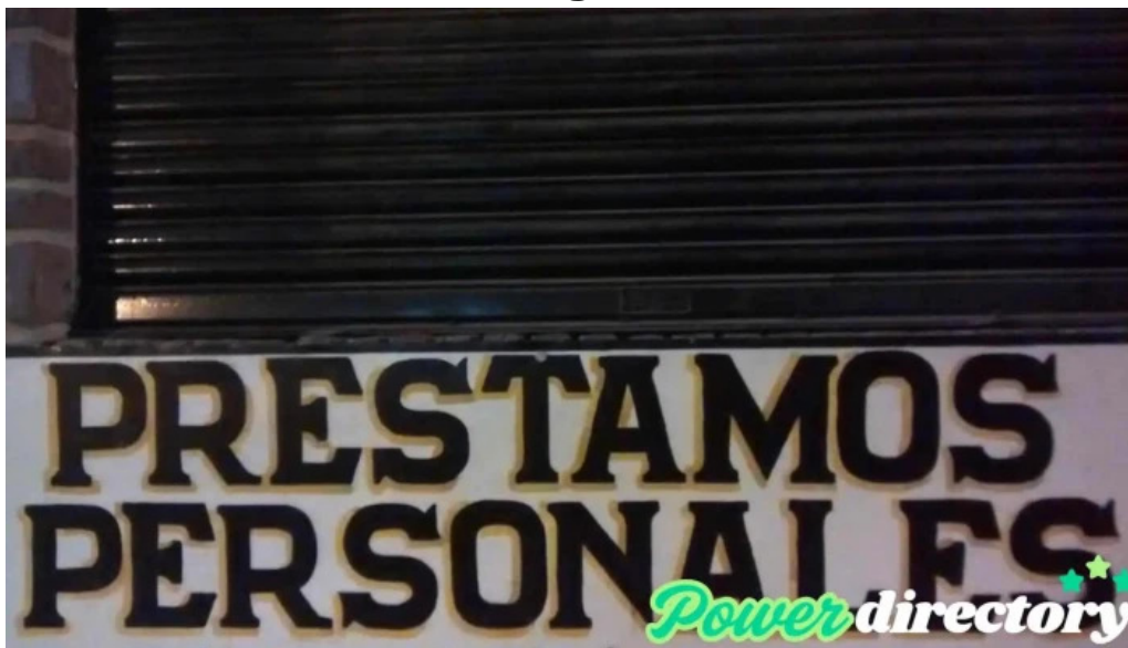
Prestamos personales rosario de lerma