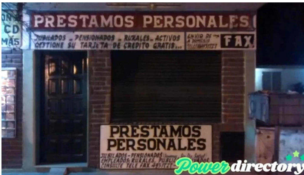
Prestamos personales exterior