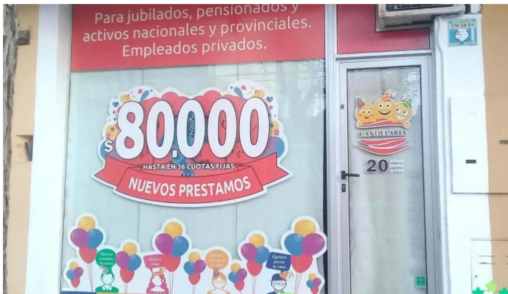
Prestamos candelaria del propietario