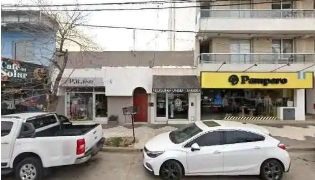
Prestamos candelaria puntaje