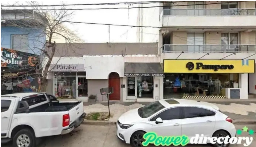
Prestamos candelaria rio tercero