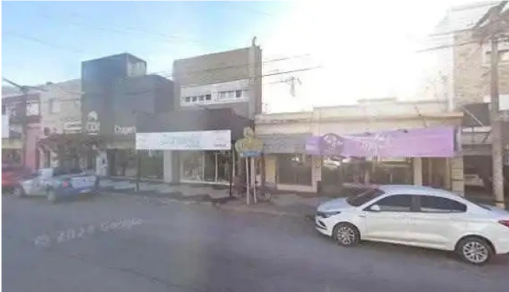
Federar abierto ahora