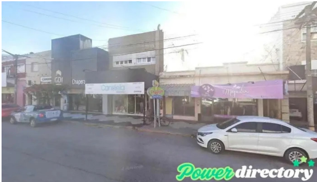
Federar rio tercero