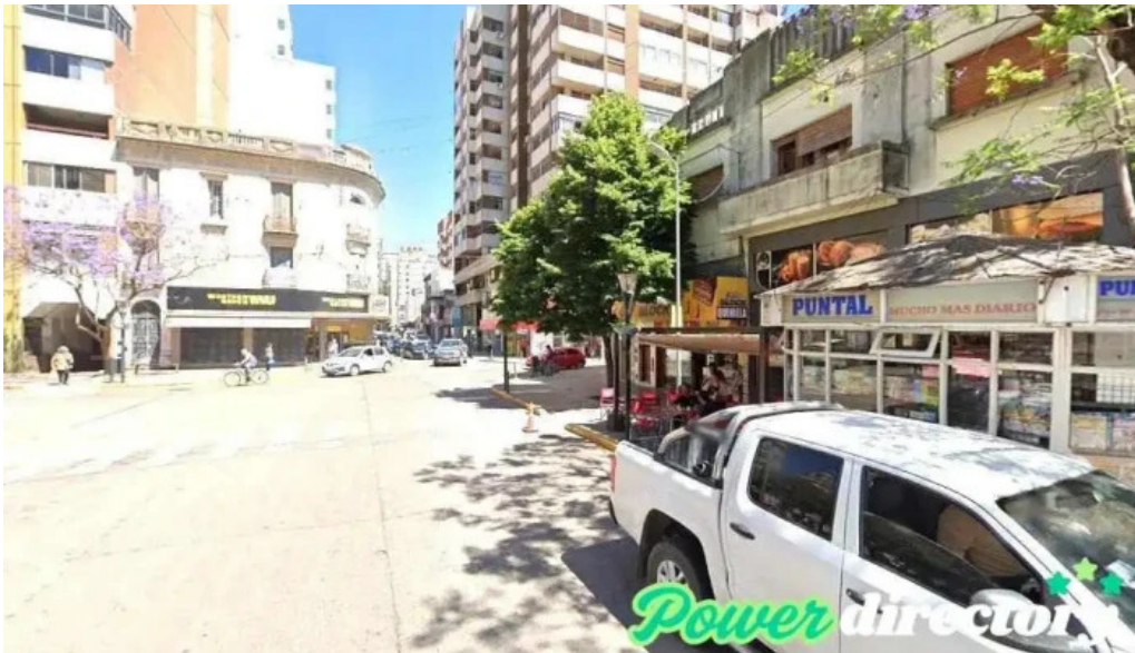
Orfa rio cuarto