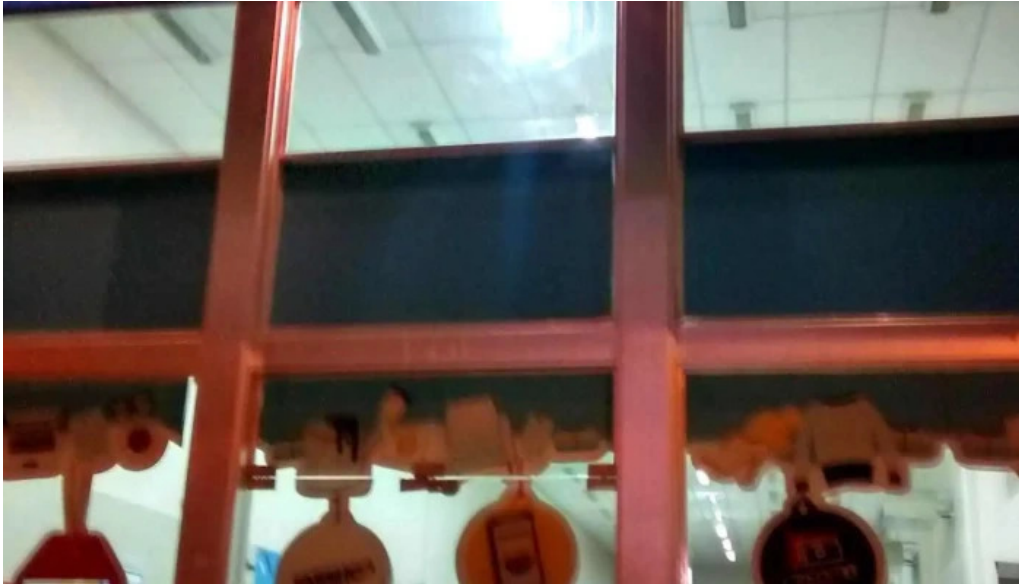
Tarjeta shopping exterior