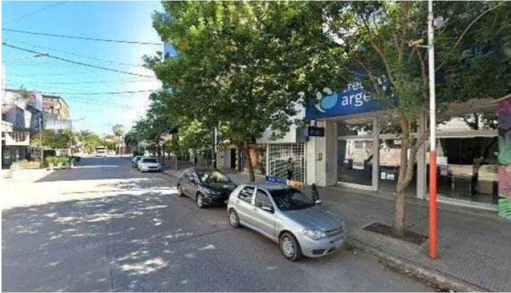
Tarjeta shopping precios