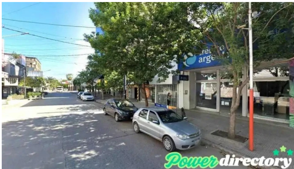
Tarjeta shopping resistencia