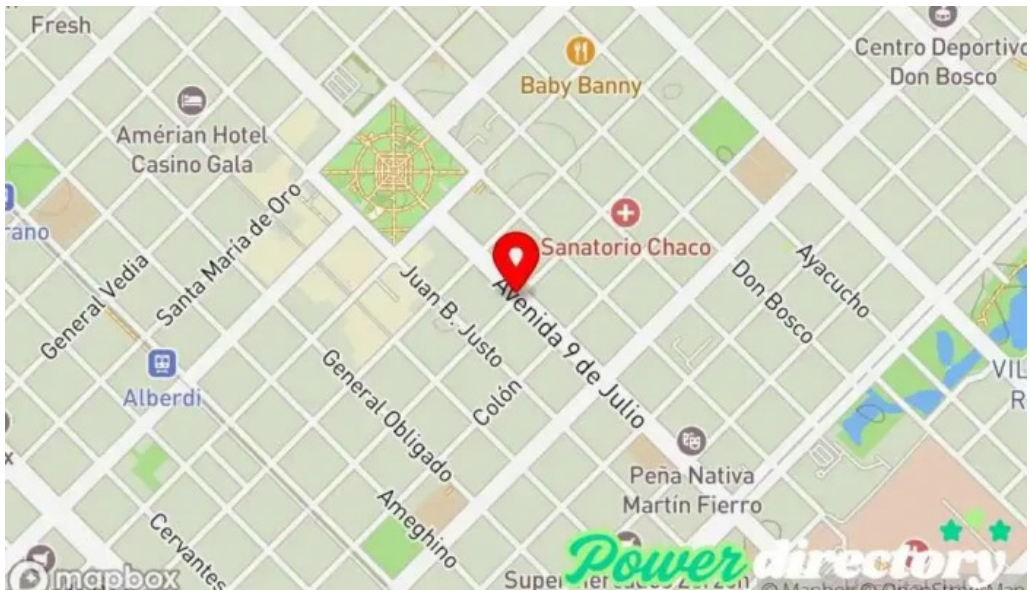
Creditos efectivos sa mapa