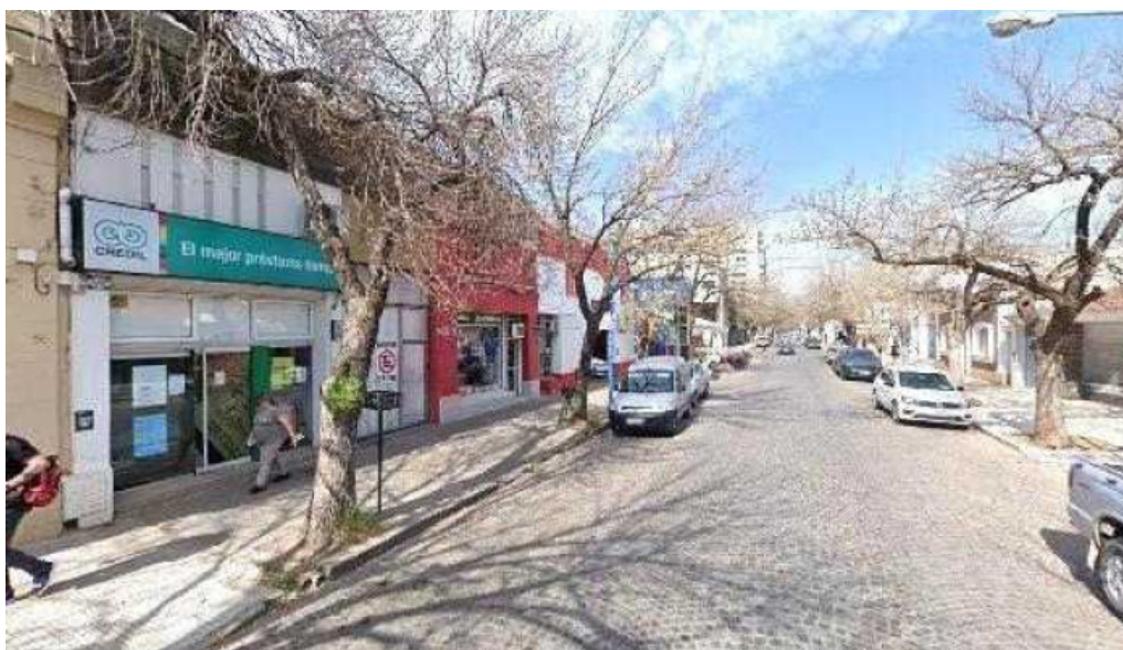
Credil prestamos en efectivo precios