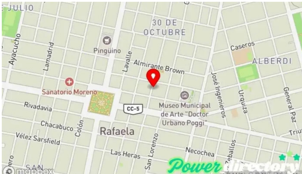
Credil prestamos en efectivo mapa