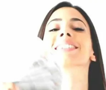
Multicred del propietario