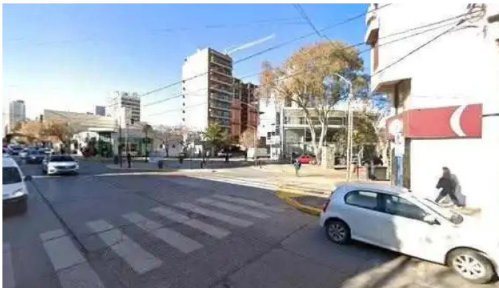
Itar prestamos personales otorgado en el momento descuentosdeg