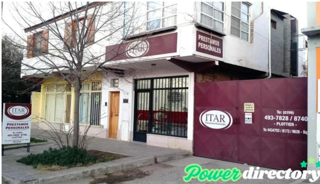
Itar prestamos personales otorgado en el momento exterior