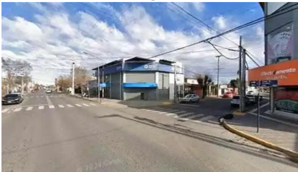
Efectivamente suc neuquen oeste puntaje