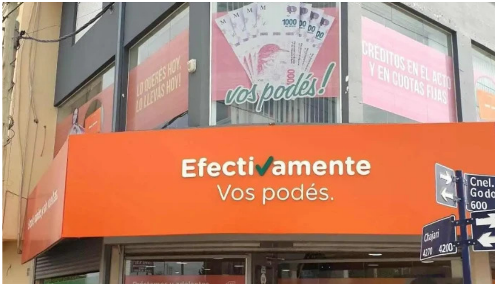
Efectivamente suc neuquen oeste exterior