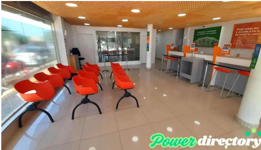
Efectivamente suc neuquen oeste neuquen