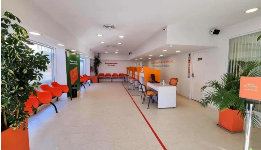
Efectivamente suc neuquen centro interior