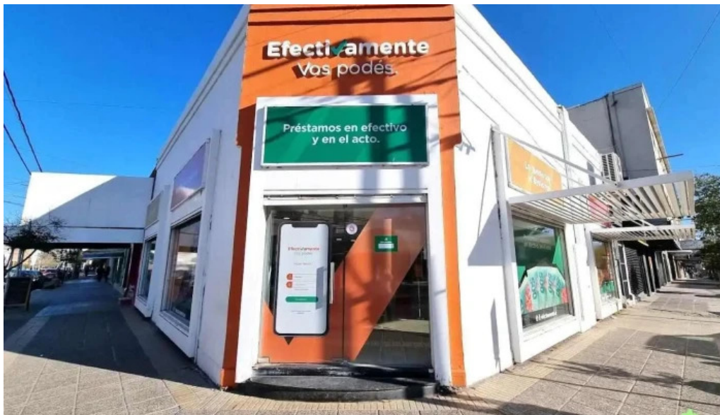
Efectivamente suc neuquen centro neuquen