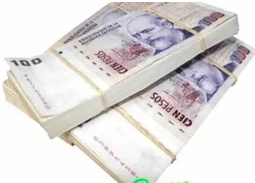
Comercred comercializadora del propietario