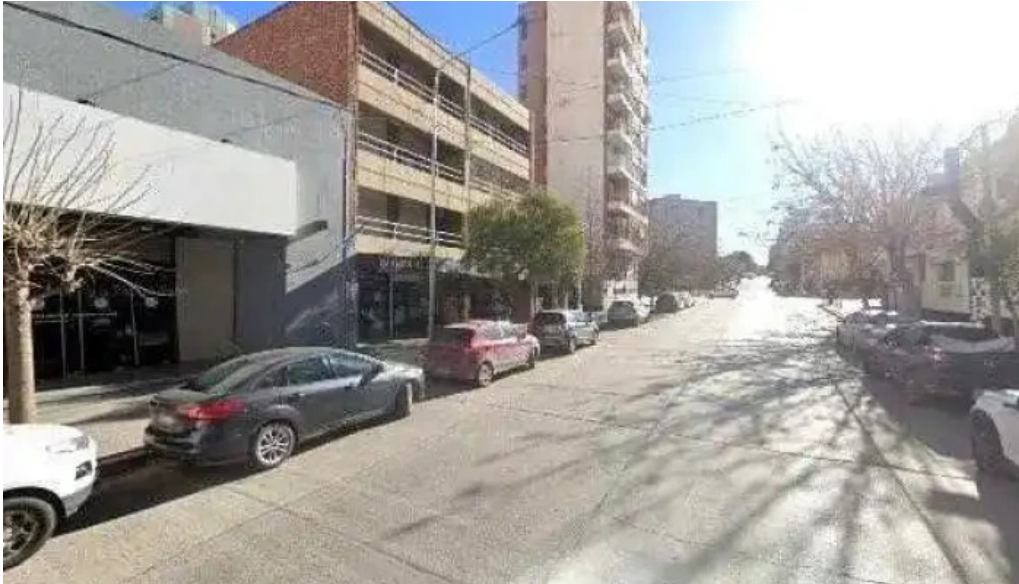
Comercred comercializadora descuentos