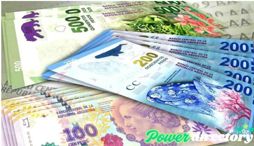
Comercred comercializadora neuquen